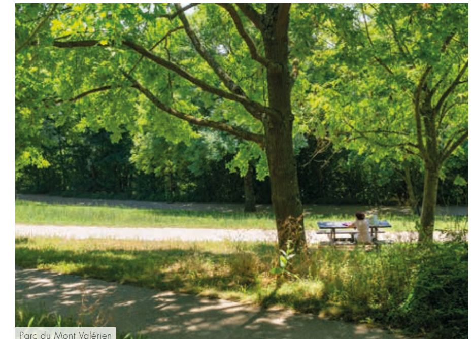
Parc du Mont Valérien