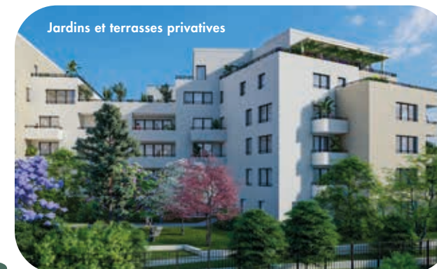
Jardins et terrasses privées