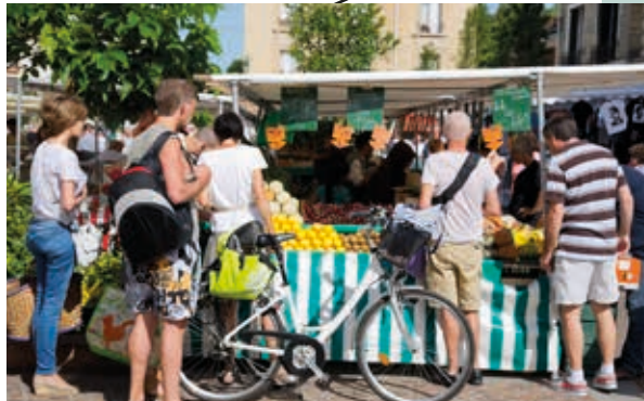
À 3 min à pied* du Marché des Godardes