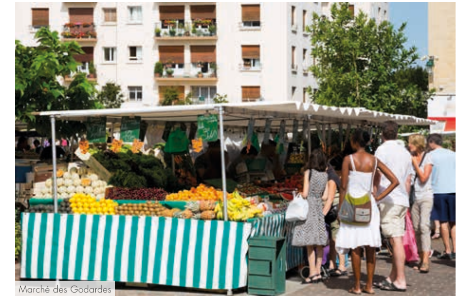
Marché des Godardes

Tout proche de Paris, Rueil-Malmaison bénéficie d'une situation géographique privilégiée, desservie par le RER A permettant une connexion rapide à la capitale, plusieurs lignes de bus et, en 2030, la ligne 15 du Grand Paris Express. Elle est également traversée par l'A86 et la D913, assurant un accès simplifié aux villes environnantes et à la capitale.