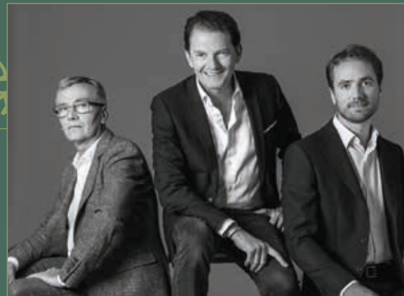
Eric Delplanque Architecte DESA

Les futurs habitants pourront ainsi constater l'harmonie qui ressort de cette intention. La mise en œuvre d'une modernité calme replace « l'Habiter » au cœur de la réflexion architecturale.