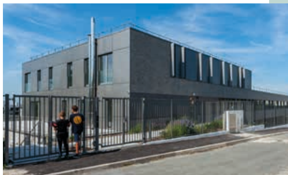
À 7 min à pied* du collège Les Bons Raisins

Les habitants profitent ainsi d'un environnement plaisant et recherché, connecté à tous les essentiels. Écoles, commerces, infrastructures sportives et culturelles ou loisirs sont accessibles à tous, en seulement quelques minutes à pied.