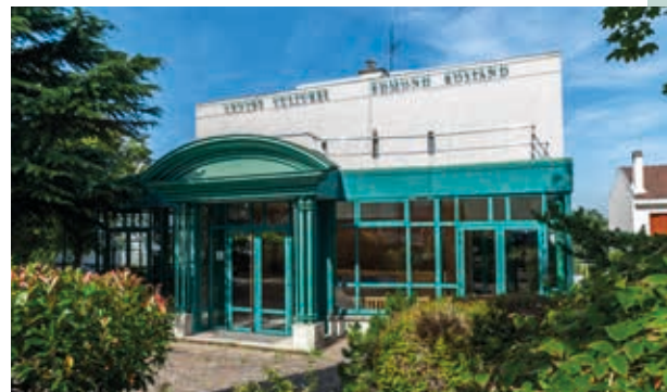
À 9 min à pied* du Centre culturel Edmond Rostand