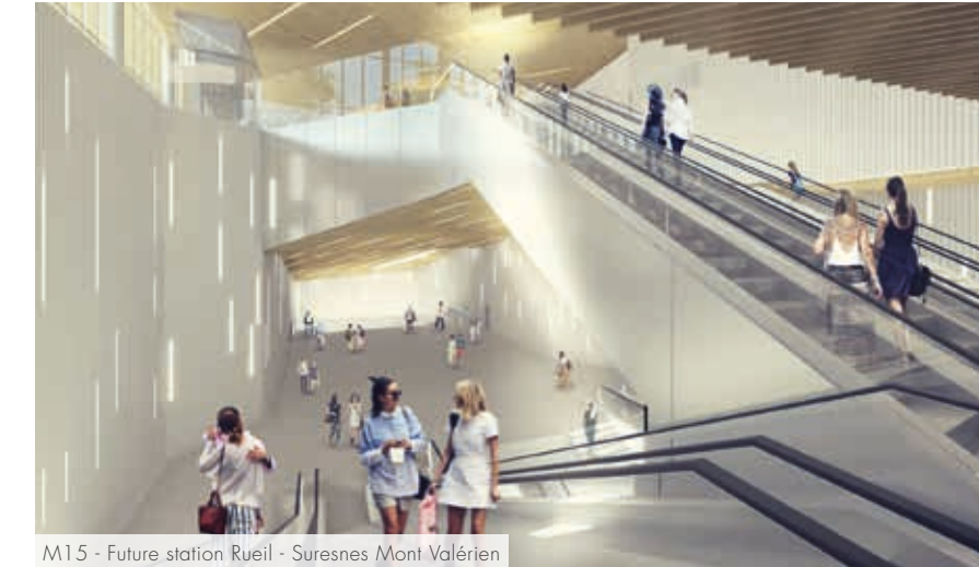
M15 - Future station Rueil - Suresnes Mont Valérien

Au cœur des Hauts-de-Seine, Rueil-Malmaison offre à ses habitants un cadre de vie calme et recherché, sublimé par une atmosphère apaisée. Bercée d'un esprit village, elle arbore un patrimoine culturel riche grâce au Château de la Malmaison, résidence de Napoléon Bonaparte et son épouse, qui lui confère le statut de ville impériale, de renommée internationale.