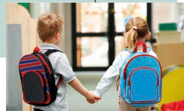
À 2 min à pied* de la maternelle Jean de la Fontaine