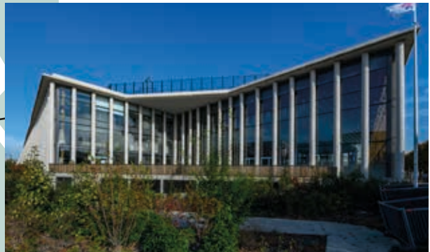
À 5 min à pied* du Complexe Omnisport Alain Mimoun comprenant le Centre Aquatique de l'Arsenal