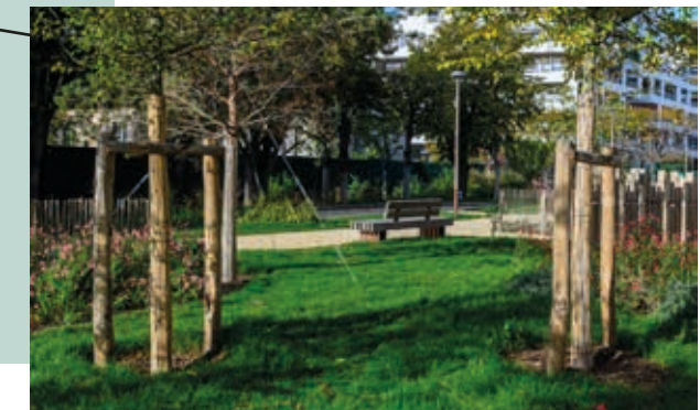
Face au parc Jacques Chirac