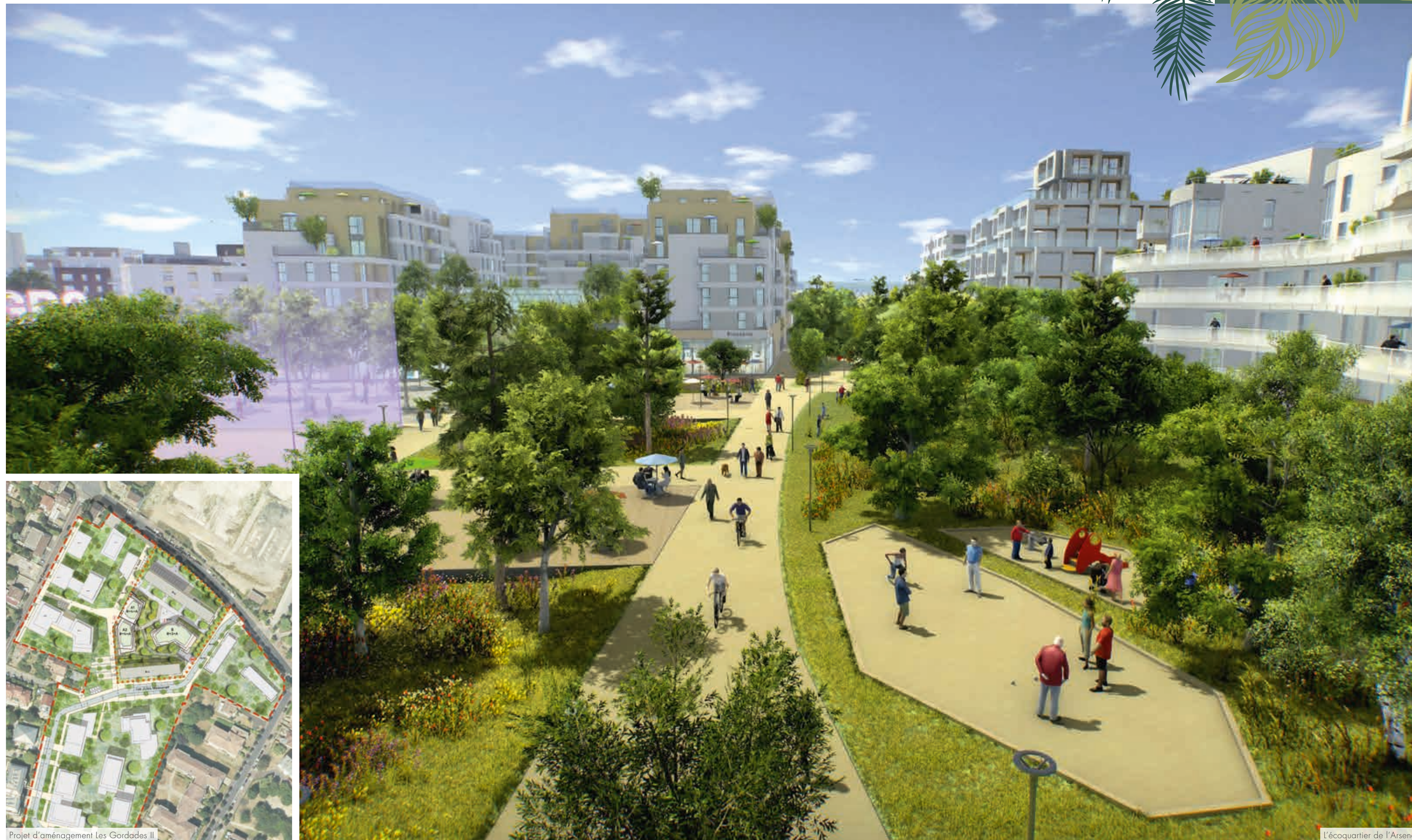
Projet d'aménagement Les Godardes II

Ici, on savoure des moments chaleureux en famille et entre voisins, tout en restant proche de toutes les commodités, des commerces, ainsi que des transports en commun. La future ligne 15 du Grand Paris Express sera par ailleurs intégrée au projet, et assurera à tous des déplacements facilités vers Paris et les villes voisines.