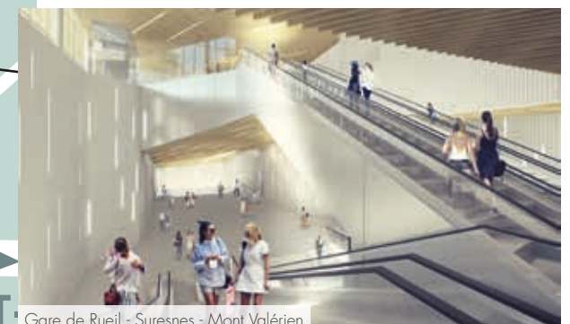
À 5 min en bus* (ligne 263) ou à 10 min à pied* de la future Gare Rueil-Suresnes Mont-Valérien, qui desservira La Défense en 9 min