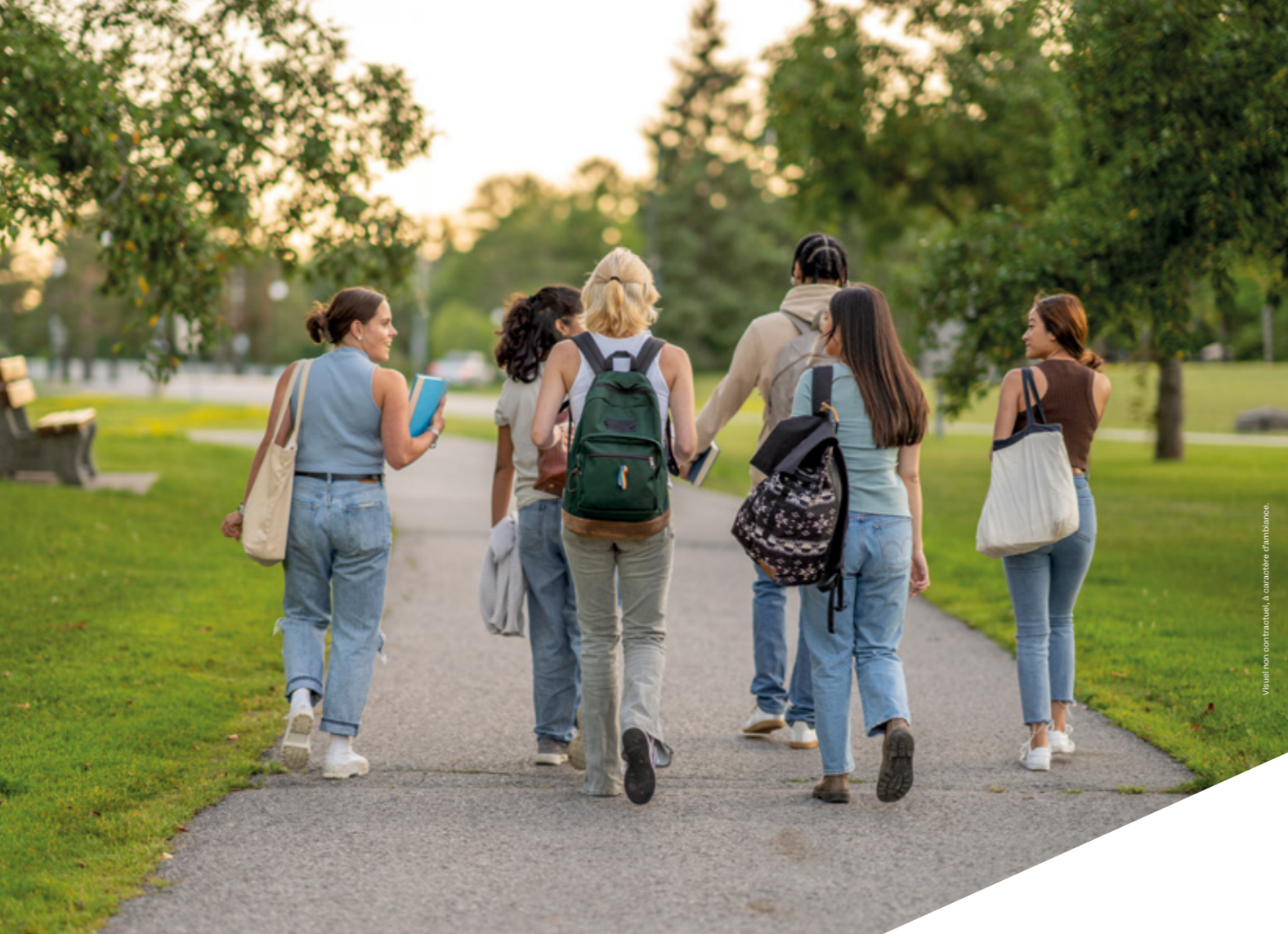
Visuel non contractuel, à caractère d'illustration.